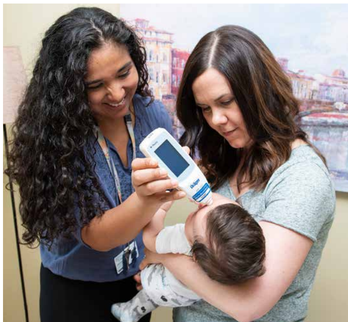
Infirmière de l'équipe des suivis postnatals à domicile de la Pointe-de-l'Île, CIUSSS-de-l'Est-de-l'Île-de-Montréal

L'affinerie CCR est fière d'avoir soutenu ce projet novateur en santé qui répond à un besoin réel de la population de l'Est de Montréal et qui a un impact positif dans la communauté.